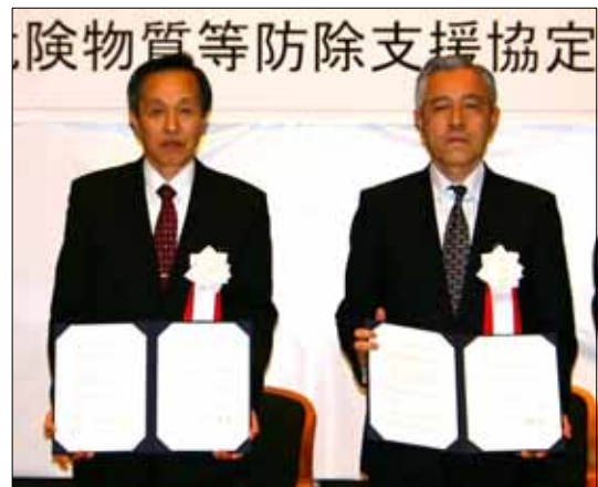
署名を終え協定書を手にする久保川崎管内排防協会長（左）と栗原センター理事長（右）

これまでに水島港湾災害対策協議会（岡山県）及び千葉管内排出油等防除協議会（千葉県）の二つの協議会との間で支援協定を締結しておりますが、このたび、九州沿岸地区では初となる大分県中